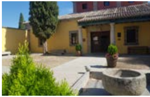
Biblioteca Municipal de Chapinería (Palacio de la Sagra)

En Chapinería, la biblioteca municipal celebraba del Día Mundial del Libro con actividades durante todo el mes orientadas a fomentar la lectura y las letras españolas. Además, ha participado en “LibroMad: El festival del libro de Madrid”, una iniciativa regional que busca dinamizar bibliotecas y acercar la literatura a la ciudadanía en torno al 23 de abril, con la propuesta poética “Almas en espejo”. De este modo, la biblioteca consolida su papel como referente cultural y espacio de encuentro en el municipio.