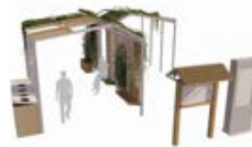
Punto de información turística proyectado

El Ayuntamiento de Chapinería pondrá en marcha un centro de recepción de visitantes en colaboración con ADI Sierra Oeste, en el marco de una estrategia conjunta para afianzar el posicionamiento del municipio como enclave natural de referencia en la Sierra Oeste. El proyecto ya ha iniciado sus primeros pasos con la celebración de reuniones entre técnicos del Ayuntamiento y responsables de comunicación del ADI, en las que se han comenzado a definir las próximas fases de trabajo. Esta iniciativa responde a la relevancia creciente de Chapinería como punto de interés turístico ligado al entorno natural, con el objetivo de mejorar la acogida, información y orientación de los visitantes que llegan al municipio.