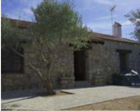
La Casa de la Laguna (Calle del Pozo Airón)

Las casas rurales de Chapinería atraviesan uno de sus mejores momentos recientes, tras varios meses de mejoras y una notable respuesta por parte de los visitantes. Este servicio turístico, clave para el municipio, se ha reforzado con actuaciones tanto en la infraestructura como en la experiencia del turista. En los últimos cuatro meses, la ocupación durante los fines de semana ha alcanzado cifras cercanas al 98%, consolidando a Chapinería como un destino cada vez más atractivo dentro del turismo rural madrileño. El mes de mayo presenta ya una situación de prácticamente lleno total y en junio, ya se encuentra en cifras del 100%. Este éxito se apoya también en las mejoras realizadas en las instalaciones. Las casas rurales han sido recientemente pintadas, ofreciendo una imagen renovada y más acogedora. Además, se ha llevado a cabo una actualización del menaje y la cristalería, elevando la calidad del equipamiento y la comodidad de los visitantes.