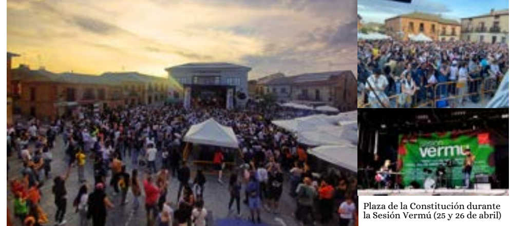
Plaza de la Constitución durante la Sesión Vermú (25 y 26 de abril)